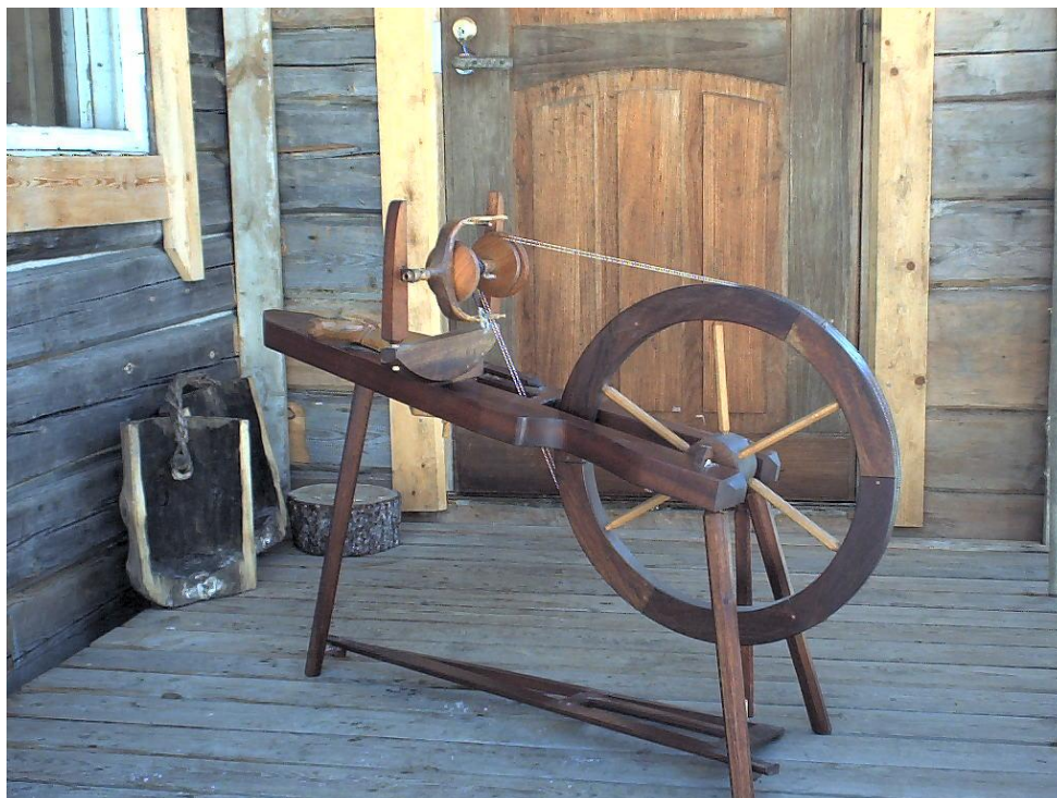
Rukissa ei tarvitse olla yhtään metallia