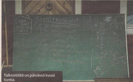
Talkootöitä on päivässä kuusi tuntia.