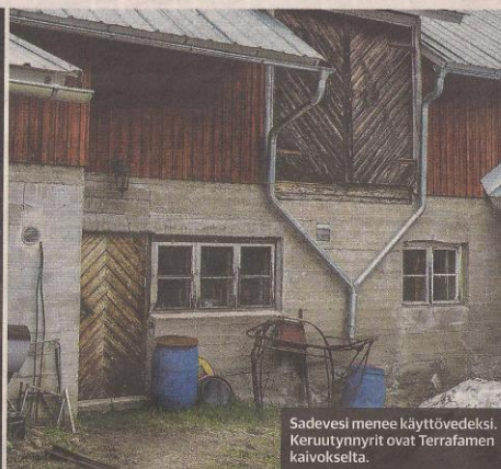
Sadevesi menee käyttövedeksi. Keruutyynyt ovat Terrafamen karvokselta.