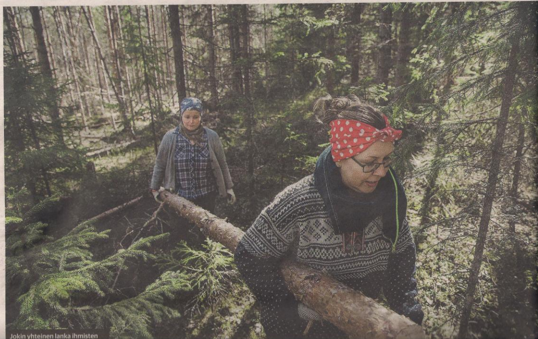
Jokin yhteinen lanka ihmisten