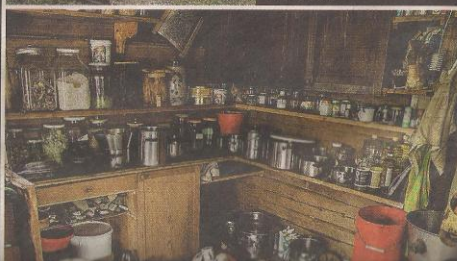
Perheen talossa on sähköt, mutta tiskit tiskataan keittiön lattialla.