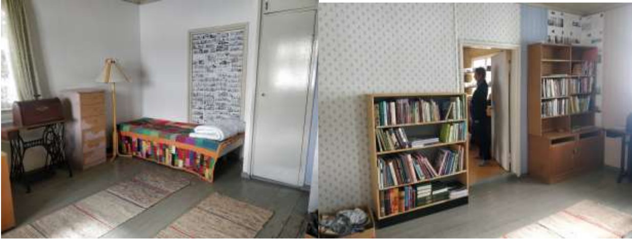
Terholan äänieristetty väliovi sarjakuvineen sekä luova kirjastonurkkaus.