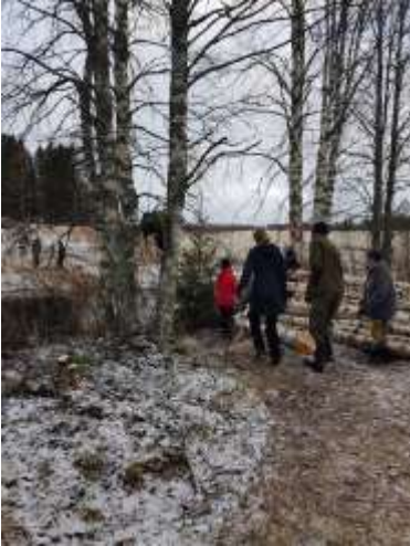
Talkoissa uitettiin rankoja joen yli

Omavaraisuuskurssista tehtiin lehtijuttu Maaseudun tulevaisuuteen heti kurssin päättymisen jälkeen, muutamat kurssille osallistuneet ja talveksi asumaan jääneet kurssilaiset osallistuivat haastatteluihin.