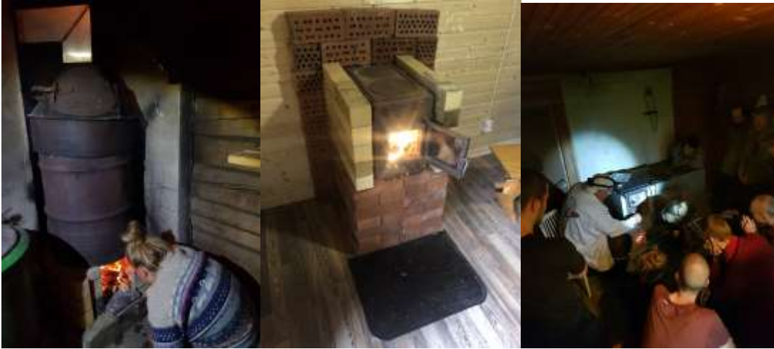
Peltolan uusi kertalämmitteinen kiuas/Repokankaan aittahuoneen kamina/Peltolan yläkerran hellankunnostus