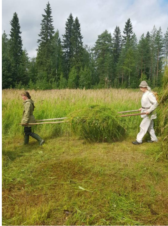
Kaksin tekemisen harha