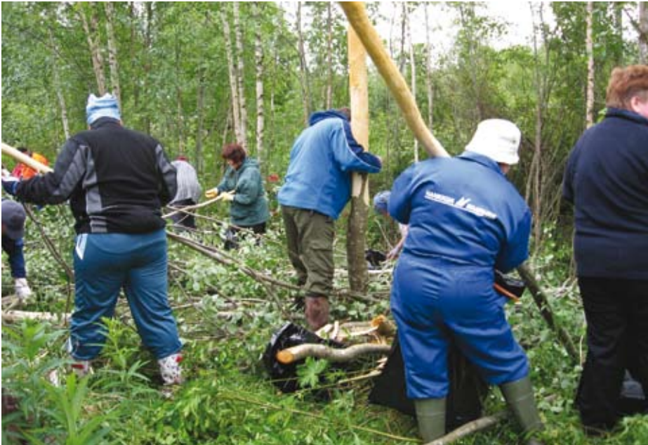
Sisnahankkeen opintomatkalaiset parkinteossa Kinnulassa.

Parkkiaineet ovat kasvien fenolisia aineosia, joita on erityisen runsaasti puuvartisten kasvien kuoriosissa. Nimensä tämä ryhmä on saanut siitä, että parkkiaineella on kyky sitoutua valkuaisaineisiin ja muuttaa (parkita) näin vuota nahaksi. (www.yrttitarha.com)