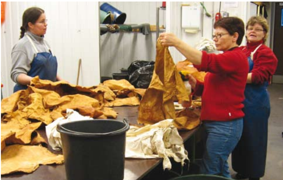
Parkituskokeilujen nahkoja syynissä.