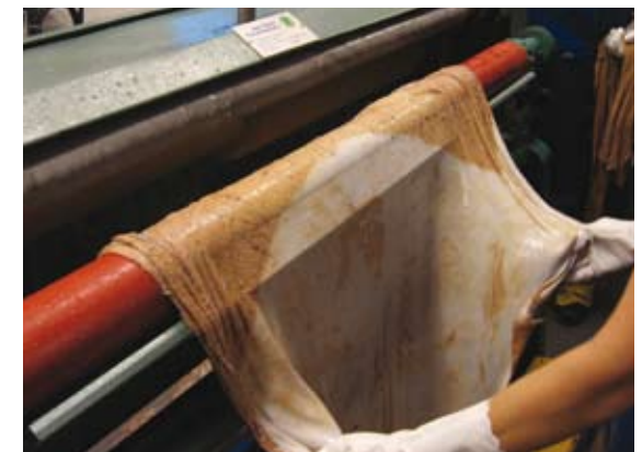
Toinen puoli nahasta jo kaavittu ja nahka käännetty toisen puolen kaapimista varten.

Nahan kaapiminen koneella on monin verroin helpompaa kuin kaavinta käsin. Kaavintakoneen käyttö vaatii kuitenkin taitoa. Toivoniemen nahkamuokkaamolla sisnoja voi kaapia sisnahankkeen neuvojen opastamana tai esim. nahkakursseilla. Helpointa nahkojen kaapiminen koneella on, kun nahkaa on parkittu sen verran ettei se ole enää liukas käsitellä. Kermikän nahoille riittää tavallisesti yksi kaavinta, mutta raavaan nahkoja voi joutua kaapimaan useamman kerran parkitusten välillä.