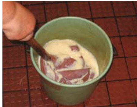
Sisnan rasvaus astiassa parkkirasvaliemessä.

Jotta nahka imisi rasvan, anna sen kuivua kunnes se on kostea kuin kuivaksi puristettu pöytäluutu. Sekoita 1dl nahkarasvaa ja 1dl parkkilientä tai vettä. Levitä nahka pöydälle kesipuoli ylöspäin ja sivele rasva nahalle esim. maalipensselillä. Näin rasvaamalla jätteesi ei jää rasvalientä, eikä rasvaa joudu viemäriin kautta luontoon.