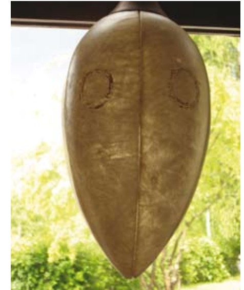
Lampunvarjostin, nahkaa. Bölebyns Garveri.