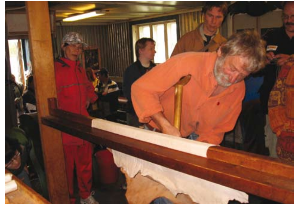
Kuivatun sisnan pehmitys. Jokkmokks Naturskinn.

Nahkateollisuudessa käytetään monia erilaisia koneita venyttämään nahkaa. Sellaisia ei Toivoniemen nahkamuokkaamossa ole toistaiseksi, joten venytämme nahat enemmän tai vähemmän käsityönä. Sisnoja voi venyttää käsin, jiekiöllä tai kaapimaraudalla, tai erityisesti pehmittämistä ja venytystä varten tehdyllä varrellisella raudalla, jonka terä ei ole leikkaavan terävä. Myös pehmityspuuta tai nahkurin penkkiä voi käyttää apuna