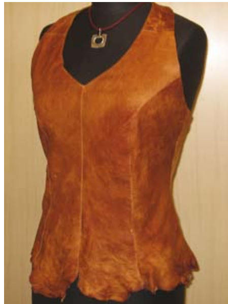
Toppi sisnanahkaa, Virpi Jääskö.

Perinteiset sisnatuotteet ovat saamenkäsitetöitä, duodjia. Sisnaa on käytetty vaatteiden, asusteiden, reppujen ja säilytyspussien materiaalina. Uusien tuotantotapojen myötä sisnaa tuotetaan jo nyt ehkä enemmän kuin koskaan. Helppottuva materiaalinsaanti antaa mahdollisuuden uusillekin sisnan käyttökohteille. Periaatteessa sisnasta voi nyt tehdä ihan mitä tahansa, ainakin mitä ylipääntään nahasta tehdään. Tuotteiden kirjo voi olla vaikka hiirimatosta sohvapäälliseen ja lampunvarjostimeen.