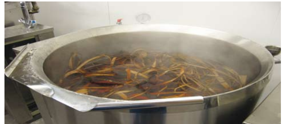
Pajunparkkia kiehumassa keittopadassa

Parkitseminen tapahtuu kädenlämpöisellä liemellä, ei koskaan yli +38°C. Parkkiintuminen kestää viikon tai jopa kaksi. Nahat siirretään aina uuteen parkkiliemeen, kaikkiaan liemiä tarvitaan jopa parikymmentä riip-puen mm. liemessä olevien nahkojen määrästä. Nahan parkitustapa ja -aste valitaan nahan tulevan käyttötarkoituksen mukaan. Jos nahasta on tarkoitus ommella esim. kahvipusseja ja muita pieniä, pehmeää nahkaa vaativia tuotteita, täytyy nahka parkita läpi, kypsäksi. Seuraava ohje onkin nahkojen parkitsemiseksi kypsäksi asti.