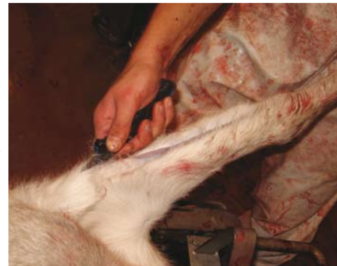
Poron etukoiven piirtäminen. Kainalosta viilto kään- netään suoraan toista kainaloa kohti.