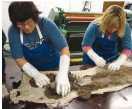
Karvat irtoavat nahasta.

Viimeisinä karvat irtoavat yleensä niskasta ja paistien päältä, joten nämä ovat hyviä paikkoja kokeilla karvan ir-