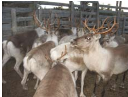
Poroja erotuksessa lokakuussa.

aaliksi kannattaa valita vain sellaisia taljoja, joista on mahdollista saada laadukkaita sisnoja.