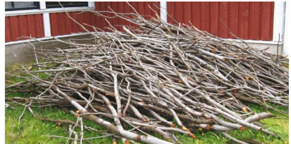
Kaadetut ja karsitut pajut odottavat kuorimista.

Kuorten kuivumisaika vaihtelee olosuhteiden ja kuorten määrän mukaan päivästä useaan päivään. Kuoren suikaleet kuivataan esim. varastossa, jossa ne voi levittää sateelta suojattuna ilmastavasti kuivumaan. Kuoria on hyvä käännellä kuivumisen aikana jotteivät ne pääse homehtumaan, varsinkin jos niitä on paksulti.