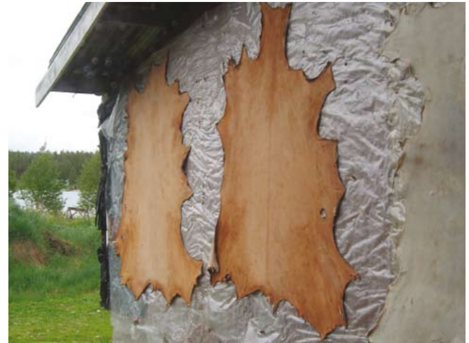
Parkitut sisnat kuivumassa. Jokkmokks Naturskinn.

edistyessä. Monet taittelevat sisnan muovipussiin ja pakastavat sen. Sisna otetaan sitten sopivalla aikaa sulamaan ja sulana sitä venytellään ja muokataan käsissä, jolloin se samalla sekä kuivuu että muokkautuu hiukan. Sisna voidaan pakastaa uudelleen ja toistaa työvaiheet, kunnes sisna on kuiva ja pehmeä. Nämä tavat ovat hitaita ja raskaita, ja sopivat silloin kun tehdään muutama sisna kerralla.