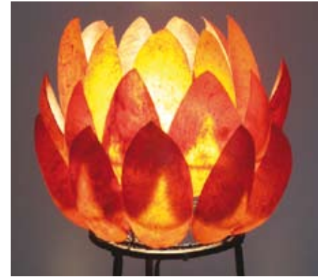
Elle Valkeapään sisnanahkainen lampunvarjostin.