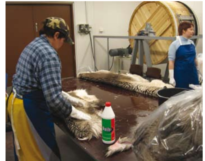
Nivotusta. Taljat pestään mäntysaippuavedellä.

Vaikka nivotus (säkissä) kuulostaa vain mekaaniselta ja hajun vuoksi epämiellyttävältäkin työltä, on se hyvin tärkeä työvaihe nahanteossa. Nivotuksen huolellinen tekeminen on edellytyksenä laadukkaalle sisnalle. Nivotus voi tuoda myös yllätyksiä, sillä koska kyse on bakteerien toiminnasta, prosessi ei ole