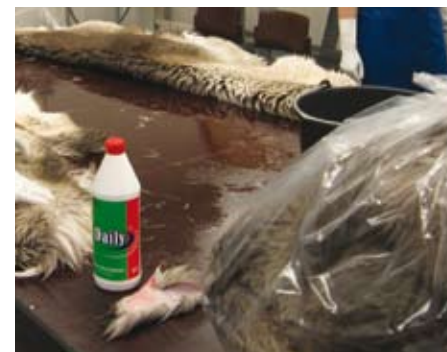
Nivotusta. Taljat pakataan säkkeihin pesun jälkeen.

Nivotus muovisäkissä on tätä nykyä yleisimmin käytetty nivotustapa. Kun nivotat taljoja säkissä, ota huomioon, että työskentelet mädättäjäbakteerien kanssa. On syytä pitää suojahanskoja kädessä, pieninkin haava käsissä