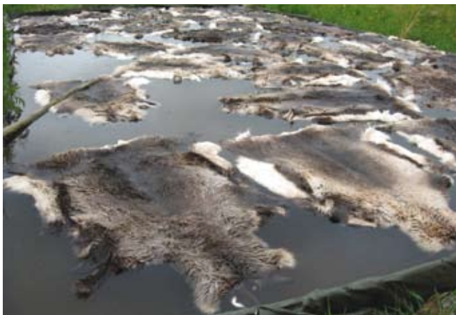
Nivotus altaassa, Jokkmokks Naturskinn.

Taljoja voi nivottaa altaassa, vähintään metrin syvyydessä lammessa tai muussa vastaavassa paikassa. Talja laitetaan veteen kesipuoli alaspäin. Ei ole haitaksi, jos vedessä on virtausta, mutta se ei ole välttämätöntä. Altaassa nivotettaessa vesi täytyy vaihtaa muutaman päivän välein. Parhaat ajankohdat vedessä nivotukselle on alku- tai loppukesä. Keskipäivällä nahkaan voi tulla matoja tai pysyviä jälkiä. Miinuksena voidaan mainita,