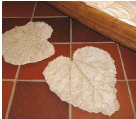
Puutarhalaatat poronkarvabetonista, Merja Heikkinen.

Kaikista taljoista ei tule hyvälaatuista sisnaa. Sellaiset taljat voi esim. kuivattaa seinällä rekitaljoiksi tai poistaa karvat, leikata, muotoilla ja kuivattaa uunissa vaikkapa koiran puruleluiksi.